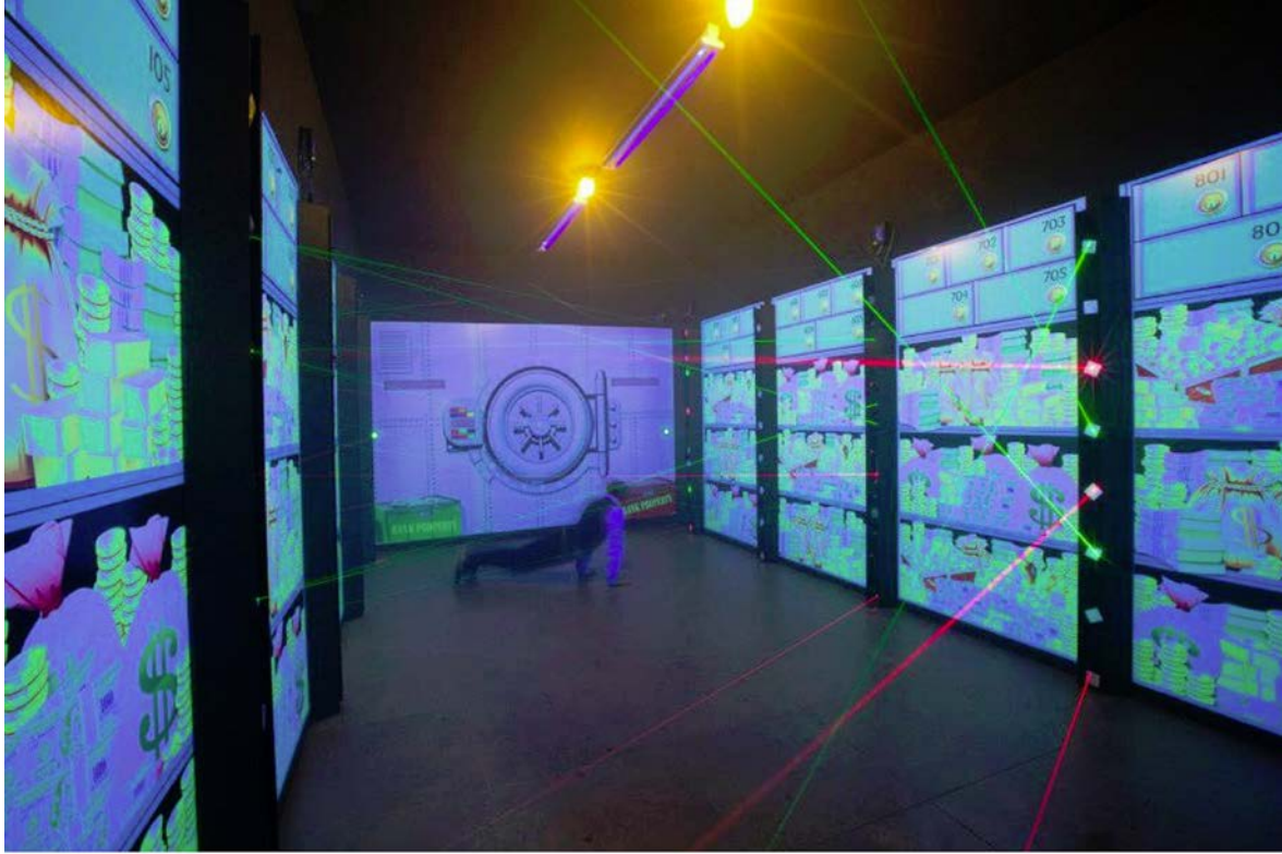
L-esperjenza ta' Labirint bil- Laser, Entrapment